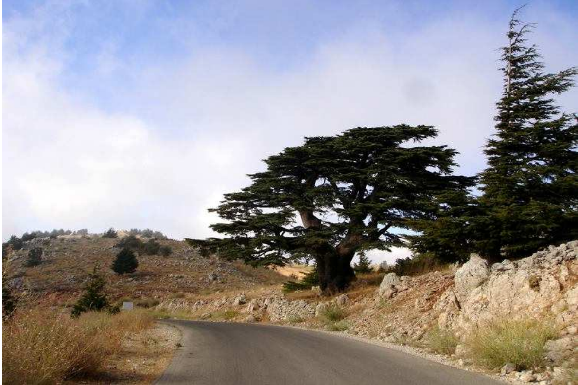
أرز الباروك