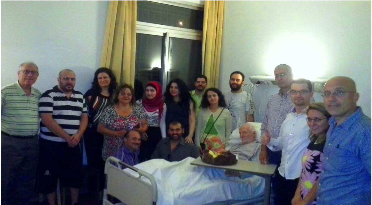
لقاء مع المطران غريغوار حداد أحد مؤسسي تيار المجتمع المدني

كل كائن إنساني له حق أول بأن يُعتبر كقيمة مطلقة ومن ثم كذات فاعلة وغاية أخيرة: كل كائن إنساني، مهما كان جنسه، وعمره، وعرقه، ودينه، وحالته الجسدية والنفسية، ووضع الاقتصاد والاجتماعي ومسلكه... له حق أول أن يُعتبر: كقيمة مطلقة: فلا يُعامل كنسبي من قبل أي كان، شخصاً، أم جماعة، أم مجتمعاً بل يجب أن يرجع كل شيء إليه ويكون نسبياً تجاهه. كذات فاعلة لا كشيء: فلا يجوز أن تقلص قيمة أي كائن إنساني فيعتبر كياناً اقتصادياً أو سياسياً تضاءلت أو تلاشت حرته، أو رقماً في سلسلة ونسخة بشرية انعدمت فرادتها الشخصية وخصوصيتها. كغاية أخيرة لا كوسيلة: بسبب كون الإنسان غاية لا يجوز أن يستعمله كائن إنساني أو جماعة ولا سيما السلطة لغاية غريبة عن ذاته.