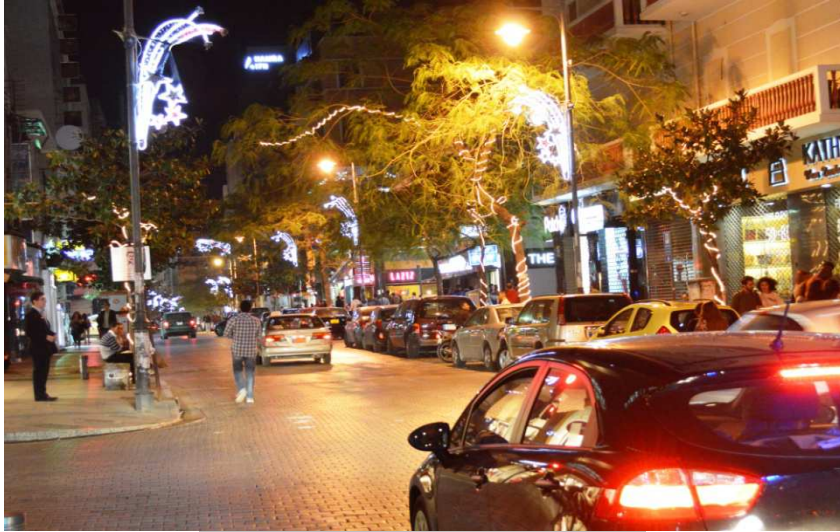
شارع الحمرا الرئيسي

هو شارعٌ ذائع الصيت، تجده ساعة ما زُرته، ليلاً أو نهاراً، ينبض بالحياة. نساءً ورجال من مختلف الأعمار والجنسيات يرتادون شارع الحمرا، كلٌّ منهم يبحث عن مقصده أو سلوته أو موعد أو لقاء، كلٌّ منهم يُحب هذا الشارع الذي يجمع بتنوعه مختلف الخلفيات الاجتماعية والثقافية ويشكّل منذ ستينات القرن الماضي ملتقى دائم لزائريه من لبنان ومن مختلف دول العالم.