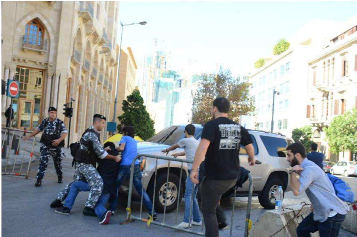
منع أحد النواب يوم ٢٠١٤/١١/٥ من الوصول إلى جلسة التمديد

وقد أصدر الحراك المدني في اليوم التالي للتحرك بياناً أكد فيه أن "نواب الأمة المُمدّدون لأنفسهم ألغوا البارحة عملية انتخابية كاملة لكنهم تسللوا إلى قاعات المجلس الذي يحتلونه منذ عام ونيف خلسة، مذلولين على وقع صراخ المُحتجين الذين حاولوا بأجسادهم منع حصول هذه الجلسة. فمنهم من دخل مشياً على الأقدام ومنهم من غير طريقه أكثر من مرّة خوفاً من صرخة الحق".