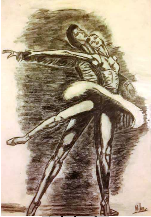
لوحة بريشة هبة بيطار